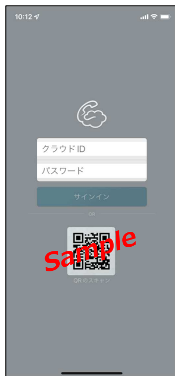
アプリの初期画面